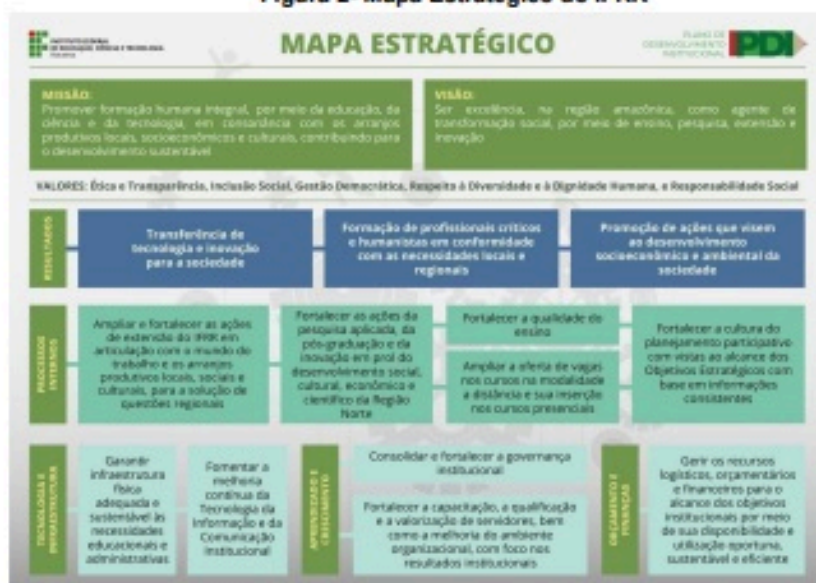
Figura 2- Mapa Estratégico do IFRR